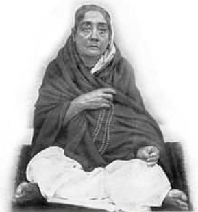
શ્રી સ્વામીજીના જન્મદિવસ

સ્વામી વિવેકાનંદનો જન્મ મકરસંક્રાંતિના તહેવાર [૯] ની પૂર્વસંધ્યાએ સોમવાર તા. ૧૨મી જાન્યુઆરી ૧૮૬૩ના રોજ કલકત્તા ખાતે શિમલા પાક્ષીમાં થયો હતો અને તેમનું નામ નરેન્દ્રનાથ દત્ત પાડવામાં આવ્યું હતું. [૧૦] તેમના પિતા